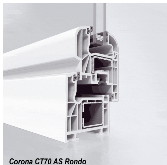
Corona CT70 AS Rondo